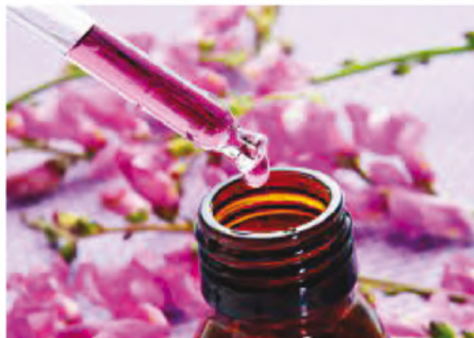
Flores de Bach