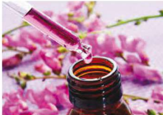
Flores de Bach