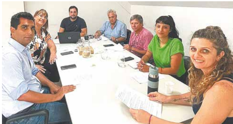
JUNTA DE LA COMUNA 11. Algunos críticos expresan preocupaciones sobre este proyecto de Ley. Cuestionan la posibilidad de que se avance sobre la privacidad y se puedan inhibir discusiones francas entre los miembros de las Juntas.

El proyecto se alinea con los principios establecidos en la Constitución de la Ciudad de Buenos Aires, que promueve la democracia participativa y la remoción de obstáculos que limiten la efectiva participación en la vida política, económica o social de la