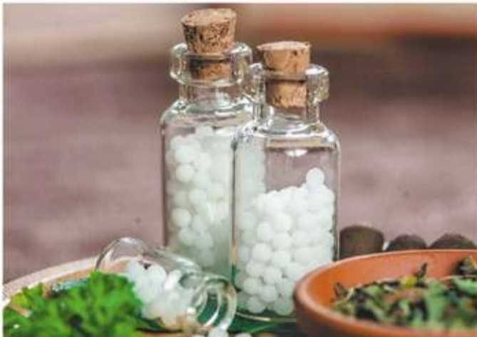
Recetas Homeopáticas y Magistrales

HOMEOPATÍA DESDE 1940 LABORATORIO PROPIO