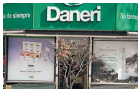
Campana 2503, V. del Parque © 11-3111-8392

Los cambios bruscos de temperatura pueden causar dilatación de capilares en