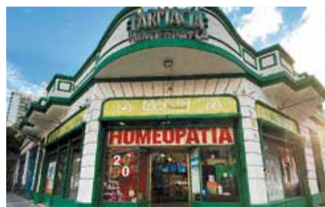
Jonte 3202, V. Santa Rita © 11-5175-3512

Aunque el sol no sea tan fuerte en invierno,