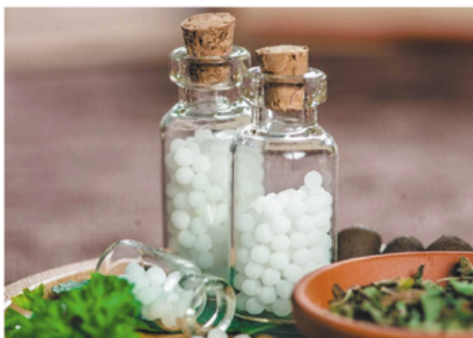
Recetas Homeopáticas y Magistrales

HOMEOPATÍA DESDE 1940 LABORATORIO PROPIO