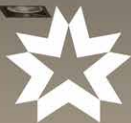
Imagen no contractual