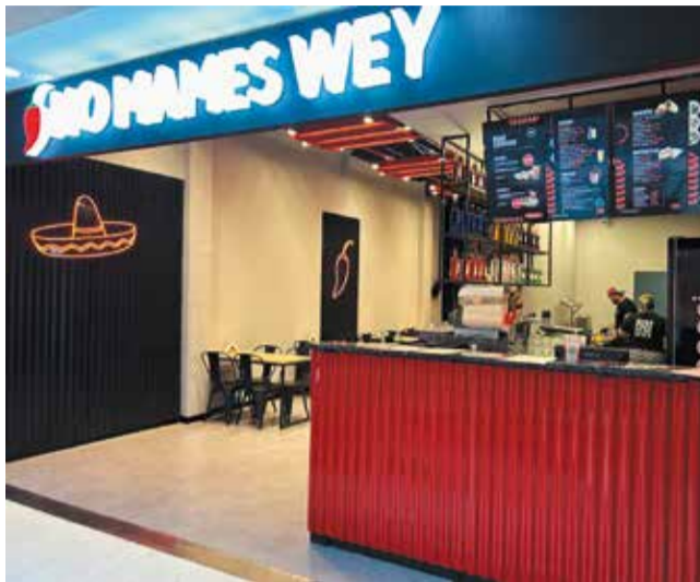
Los Tacos más hot llegaron a Devoto Shopping. Encontralos en el patio de Comidas del nivel 3.