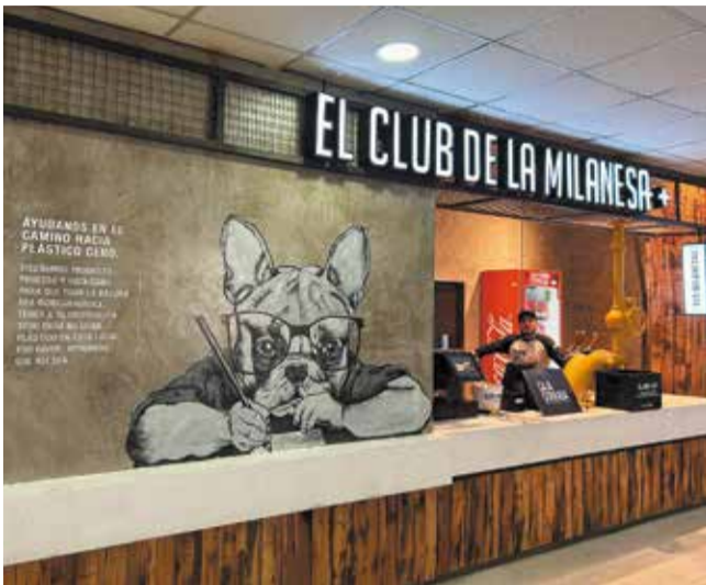
El Club de la Milanese abrió su local en el Patio de Comidas del nivel 3 del shopping.