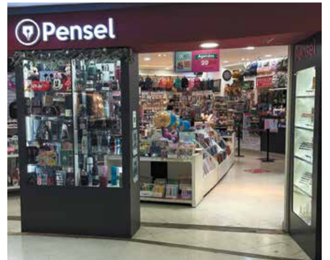
En Pensel podés encontrar mochilas, útiles, cartucheras, accesorios y todo lo necesario para la Vuelta al Cole!.

Con el firme compromiso de afianzar día a día su crecimiento, ofreciendo las mejores posibilidades de compra y entretenimiento dentro de su centro comercial, Devoto Shopping convoca siempre con la certeza de ser un referente excluyente para vecinos