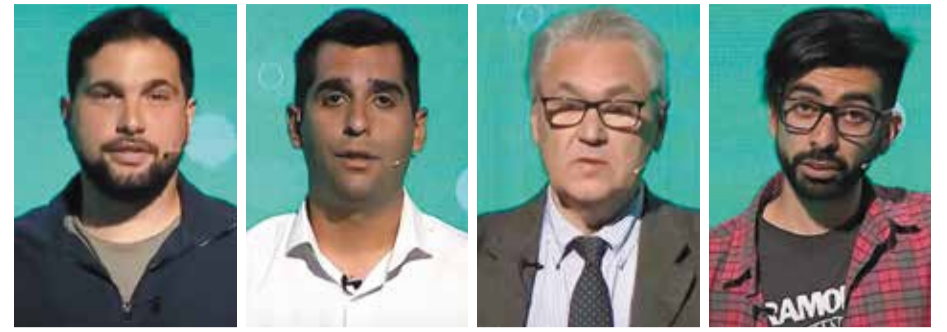
Debatieron en el Canal de la Ciudad, dos semanas antes de las elecciones.

Otro asunto vinculado al funcionamiento de acuerdo a la Ley de Comunas fue el Consejo Consultivo. El actual presidente celebró como un logro que este organismo “funciona ininterrumpidamente hace dos años”, después de su falta de funcionamiento.