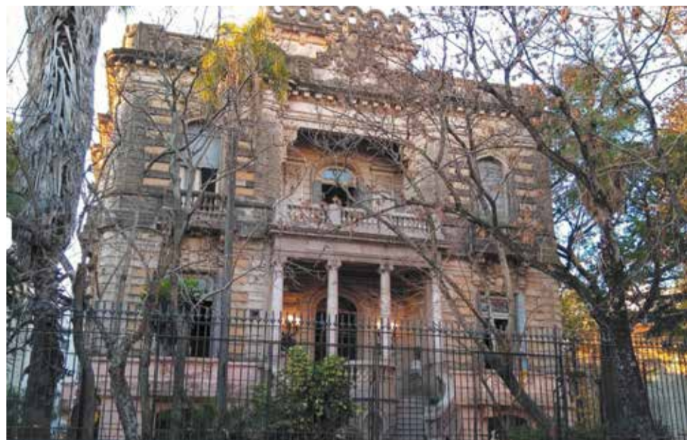
Desde 1938 funciona en el lugar la Escuela Bartolomé Ayrolo.

En los argumentos, los magistrados indicaron que “no se explica, por ejemplo, cuál fue la razón por la que la licitación pública no podía ser llevada a cabo estando el palacio en la órbita de la Dirección General de Educación de Gestión Estatal o cuál era la conveniencia de pasarlo a la Dirección General de Administración de Bienes”. Y cuestiona que “habiendo sido oficiado para informar acerca del destino que se daría al Palacio Ceci, el Gobierno porteño se limitó a responder que las reformas que se realizan en el Palacio en nada alcanzan al establecimiento educativo que funciona en el inmueble de Avenida Lincoln, desarrollando sus actividades escolares propias”. Una respuesta definida