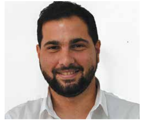
La Comuna 11 eligió el pasado 22 de octubre los cargos nacionales y de la Ciudad de Buenos Aires.

nacional, pueden analizarse las preferencias de la Comuna 11 para la elección presidencial. El 41% le dejó su apoyo a Patricia Bullrich , con 54 mil votos. El 31% a su vez apoyó a Sergio Massa (41400 adhesiones), lo que denota que Jorge Macri tuvo un corte decididamente positivo respecto a la candidata en esta categoría en Juntos por el Cambio , y Leandro Santoro , por el contrario, fidelizó el aval al Ministro de Economía.