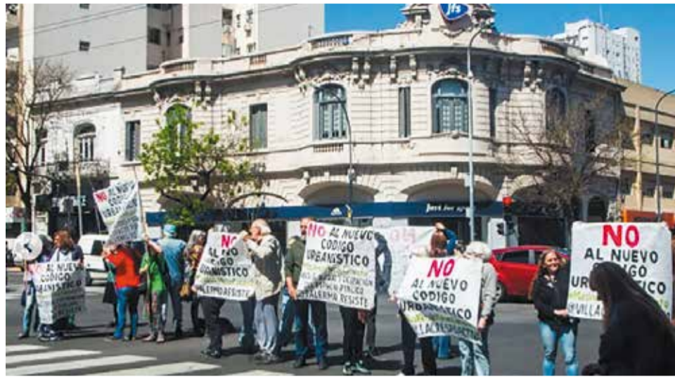
Cuenca y Nogoyá fue uno de los puntos de las protestas de octubre, que tuvieron varias sedes y una gran campaña en las redes sociales.

Así, repitieron la tónica que vienen mostrando hace ya dos años, cuando iniciaron las protestas callejeras con el lema "No al Código Urbanístico". La gran novedad de este tiempo, sin embargo, es la conformación de la Interbarrial Buenos Aires, que reúne a vecinos/as de distintos barrios porteños, entre ellos, Villa Devoto y Villa del Parque. Precisamente una esquina de este último (Cuenca y Nogoyá), fue una de las cuatro sedes del Semaforazo del pasado 7 de octubre, en el que se congregaron decenas de personas.