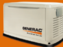
17 KVA TRIFÁSICO