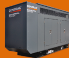
DE 35 KVA HASTA 500KVA