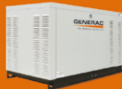
22 / 27 KVA TRIFÁSICO