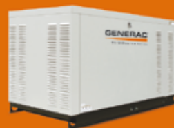
22/27 KVA TRIFÁSICO