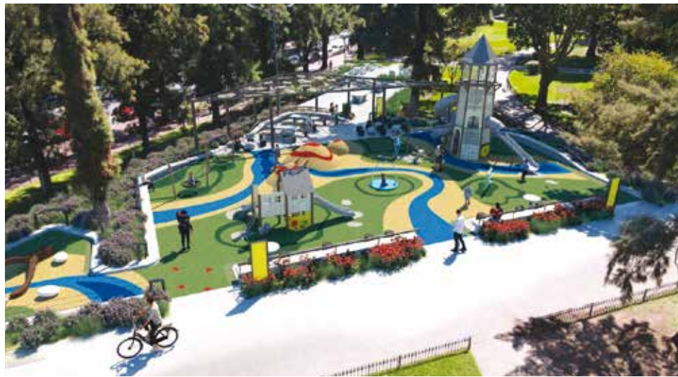
Los render muestran cómo quedará el lugar cuando finalicen las obras, a cargo de la Junta Comunal 11. Restan trabajos menores y detalles.

En diálogo con la Comuna 11, este medio pudo averiguar que a más tardar a mediados de enero estará lista la obra, que se inició a principios de octubre en la plaza de Nueva York y Mercedes. Ya está finalizada toda la estructura perimetral de hormigón, y en la semana previa a la Navidad se avanzó con el piso del coworking, intertrabado. Lo próximo será que los proveedores entreguen los juegos y se lleve a cabo el soldado de