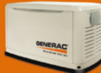
17 KVA TRIFÁSICO