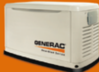
13 KVA MONOFÁSICO