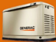
8 KVA MONOFÁSICO