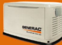
17 KVA TRIFÁSICO