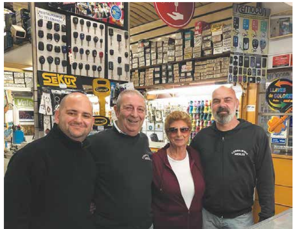
Todos los servicios de cerrajería para la casa y el automotor. Taller propio y servicio a domicilio.

Con el correr de los años, Cerrajería Ardiles se ha convertido en un lugar ideal a la hora de solucionar cualquier inconveniente que pueda presentarse en materia de llaves o si es necesaria la realización de arreglos y cambios de cerradura tanto en una casa como en un automóvil. En este aspecto, cabe señalar que trabajan con