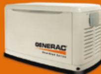
13 KVA MONOFÁSICO