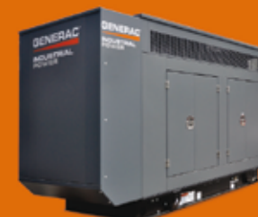
DE 35 KVA HASTA 500KVA