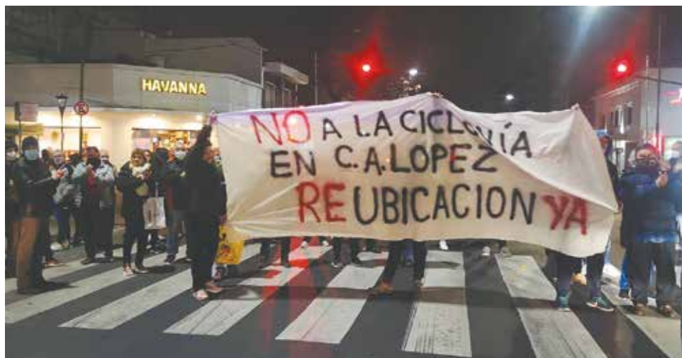
Vecinos de Devoto y Pueyrredón vienen organizando "semaforazos" los jueves en Mosconi y Artigas solicitando mudar el proyecto hacia arterias linderas.

"Tras ese anuncio nos enteramos que también se programaba colocar una ci-