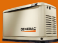
8 KVA MONOFÁSICO